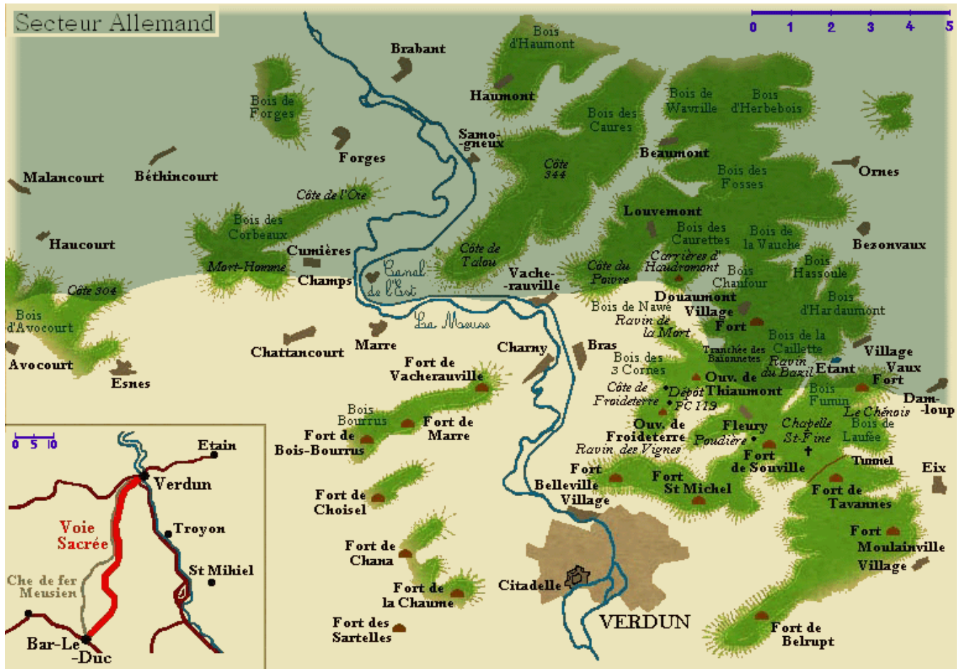
Front au 8 juin 1916